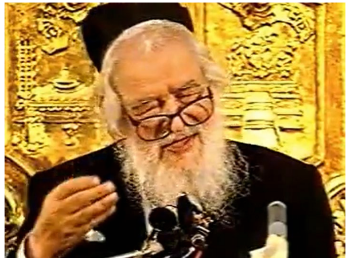
וְשִׁמְרוּ דְּרָךְ ד' (יה"ט)

לאחר שסיים את דבריו, שאלתי את מרן: "מה למעשה יעץ להם ראש הישיבה?" השיב מרן: "מה יכולתי לעשות? הצעתי להם, שילכו לאחד מהגדולים, אמרתי להם אפילו למי ללכת (לפי השערתי היה זה מרן הקהלות יעקב, שבספרו הוא דן בנושא זה), אך הם לא